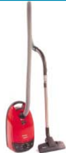
MIELE Cat & dog 700S716

Skal være spesialmaskin for fjerning av hår fra kjæledyr. Men den er ikke best. Bedre på fjerning av hår fra kjæledyr, er en annen og billigere – Miele-modell (S571).