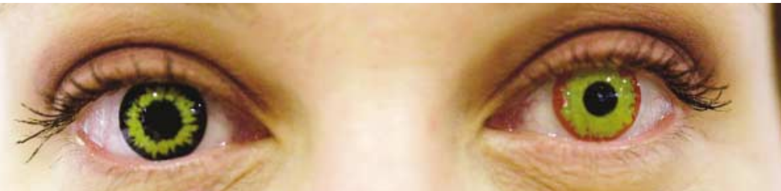
Sommerens slager? På øyet til venstre, sitter en «rovdyrlinse». Til høyre en linse med røde flammer.