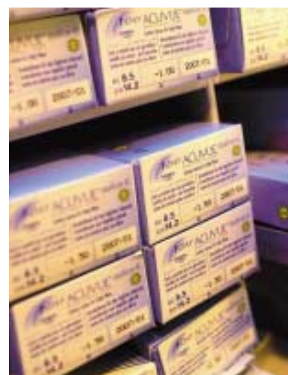
Brilleland er billigst på månedslinser.

En annen måte å fortolle på, er at den som sender varene sørger