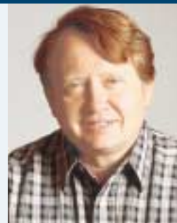
Av PER ANDERS STALHEIM Forbrukerrådets direktør

Og alle har vel innerst inne en viss glede av å sitte og se på verdien av egen bolig bare stiger og stiger, og at man blir stadig «rikere». I likhet med meg er det