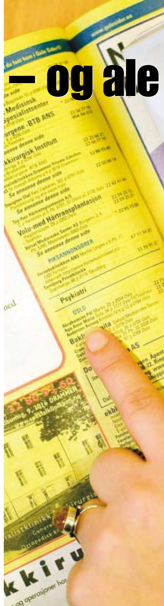
Psykiater, psykolog eller psykoterapeut? Ikke lett å vite hvor

–Det er lite hensiktsmessig å sette folk på venteliste i to år. Det er belastende å holde