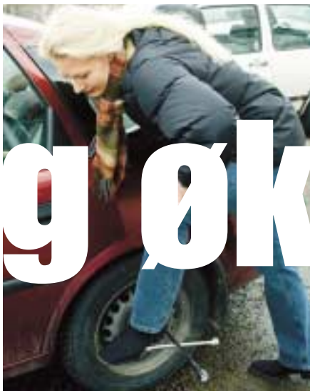
Peile olje. Skifte dekk. Ikke bare nyttig, men også kalordrivende!