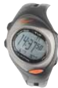
Nike: Viser ikke gjennomsnittspuls, men nøyaktig og robust.

Forbruker-rapportens produkttester finner du på www.forbrukerradet.no