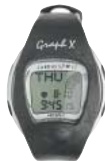
Cardiosport Graph X: Mange funksjoner. Ikke vannrett. Dårlig håndbok.