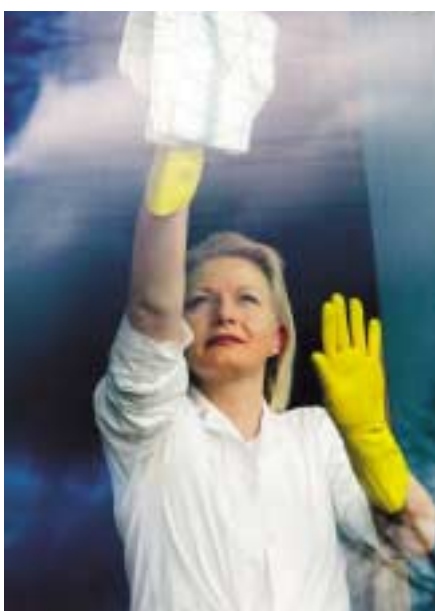
Vask vinduer, og forbrenn 259 kalorier i timen.