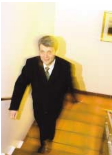
Gå opp trappene og forbrenn 1079 kalorier per time. Går du ned trappene, er kalorigenbruket under halvparten. Gjelder også statsråd Høybråten!