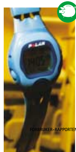
Polar A5: Litt påvirkbar av ytre kilder. Må sendes inn for batteriskift.